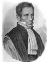
René Théophile Hyacinthe Laënnec

Unter den Forschern dieser Periode auf dem Gebiete der Anatomie und Physiologie sind zu nennen Christian Gottfried Ehrenberg (1795—1876), verdienter Mikroskopiker, dessen Schrift «Die Infusionstierchen als vollkommene Organismen» (1838) für die Entwicklung der Bakteriologie von Bedeutung ist,